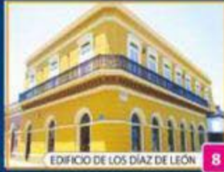
EDIFICIO DE LOS DÍAZ DE LEÓN 8