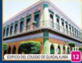
EDIFICIO DEL COLEGIO DE GUADALAJARA 12