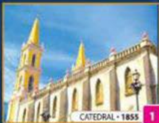
CATEDRAL • 1855 1