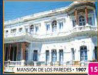
MANSIÓN DE LOS PAREDES • 1907 15