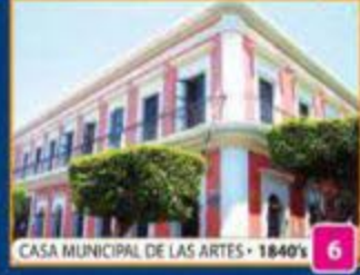
CASA MUNICIPAL DE LAS ARTES • 1840'S 6