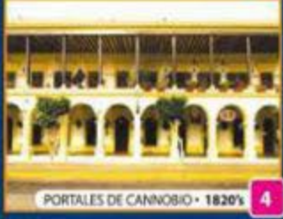
PORTALES DE CANNOBIO • 1820'S 4