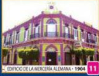
EDIFICIO DE LA MERCERÍA ALEMANA • 1904 11