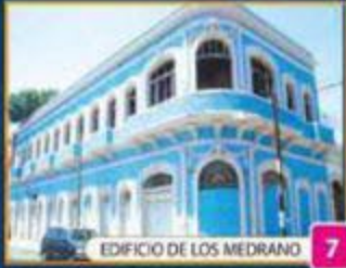
EDIFICIO DE LOS MEDRANO 7