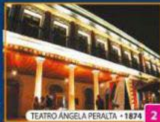
TEATRO ÁNGELA PERALTA • 1874 2