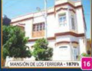
MANSIÓN DE LOS FERREIRA • 1870'S 16