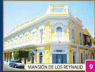
MANSIÓN DE LOS REYNAUD 9