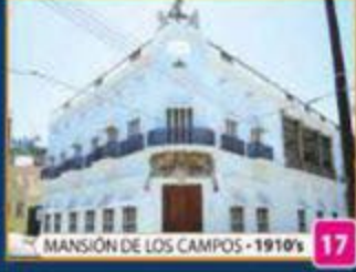
MANSIÓN DE LOS CAMPOS • 1910'S 17