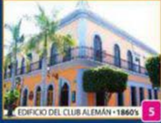
EDIFICIO DEL CLUB ALEMÁN • 1860'S 5