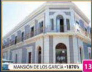
MANSIÓN DE LOS GARCÍA • 1870'S 13