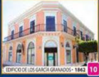
EDIFICIO DE LOS GARCÍA GRANADOS • 1862 10