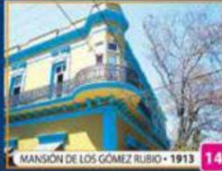
MANSIÓN DE LOS GÓMEZ RUBIO • 1913 14