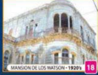
MANSIÓN DE LOS WATSON • 1920'S 18