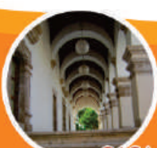
CASA DE LA CULTURA

Gran embalse de aguas útiles para agricultura y la generación de electricidad. Está formado por las aguas del Río Fuerte que desciende de la Sierra Madre Occidental.