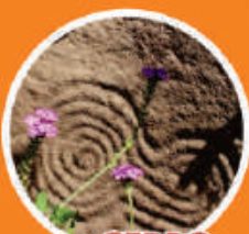
CERRO DE LA MASCARA

Fue edificada en 1854. Sus gruesos muros de mampostería carecen de ornamento alguno, mostrando estilo recio y austero