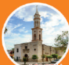
IGLESIA SAGRADO CORAZÓN DE JESÚS

Punto de reunión donde se puede disfrutar de domingos culturales y artísticos; destacado por las espigadas palmeras y su kiosco de hierro forjado. Fue fundada