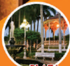
PLAZA DE ARMAS

Punto de reunión donde se puede disfrutar de domingos culturales y artísticos; destacado por las espigadas palmeras y su kiosco de hierro forjado. Fue fundada