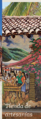
Tienda de artesanías