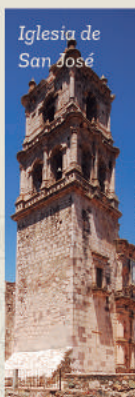
Iglesia de San José

Diseñada por el maestro arquitecto Jesús Ortizaga, la fachada de cantera, sobria y elegante, su recia torre de dos cuerpos de altura y la hilera de contrafuertes soportando el peso de los ancestrales muros, forman una estampa que llama la atención.